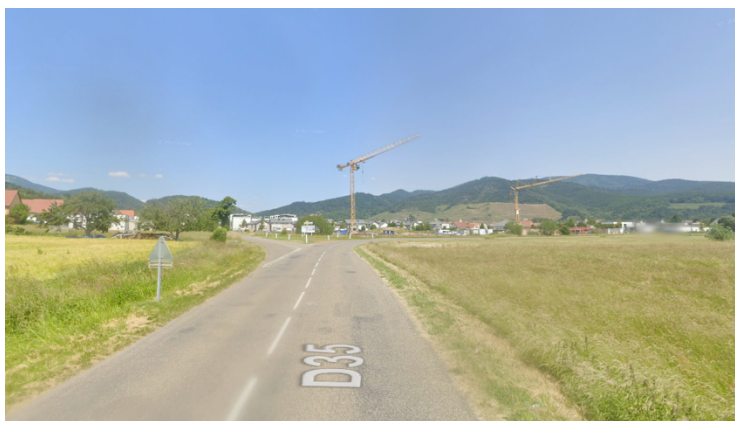
Vue du carrefour qui sera modifié

La mise en service du barreau routier entraînant des modifications de circulation, des études de sécurisation du carrefour entre l'avenue Pasteur et la RD35 seront lancées en 2024, pour en améliorer la visibilité. Le projet de piste cyclable porté par la CCTC sera intégré aux travaux.