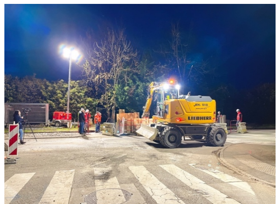
Travaux réalisés de nuit sur la RD1066 à Vieux-Thann en avril