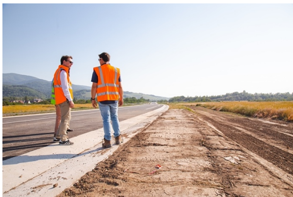
Photo prise durant le chantier du barreau

Les cyclistes auront la possibilité de rejoindre la Gare de Vieux-Thann ZI dès 2024, en empruntant la piste cyclable réalisée à proximité immédiate du Barreau routier, depuis Leimbach ou le Parc d'Activités du Pays de Thann/Cernay.